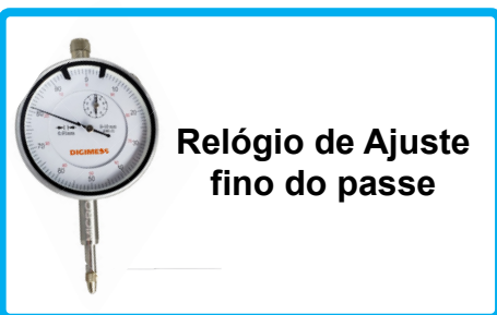
Relógio de Ajuste fino do passe